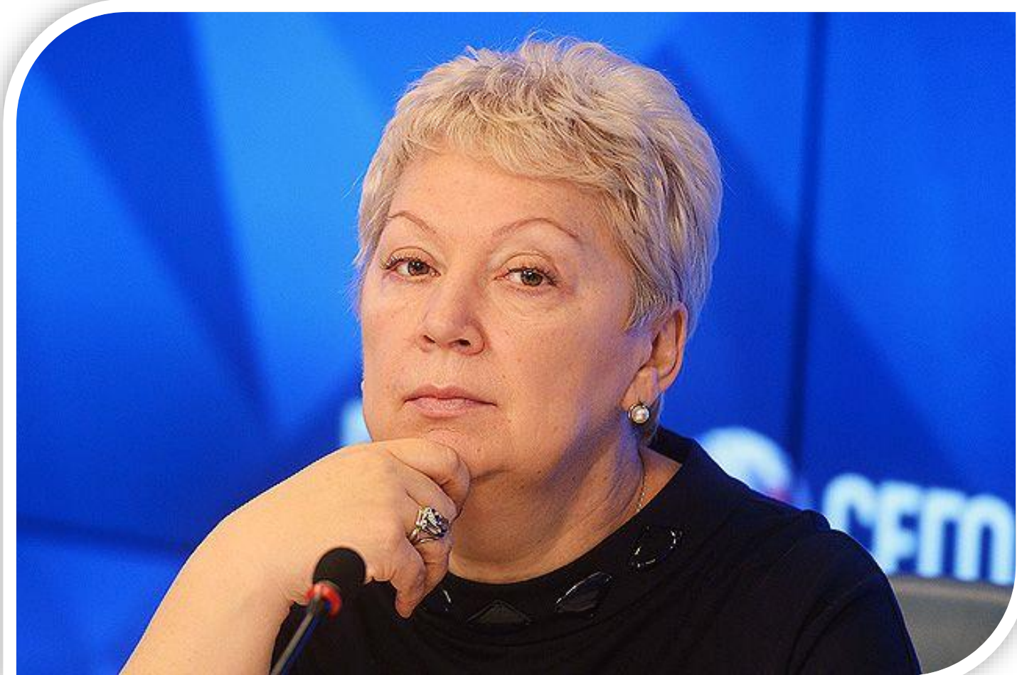
Васильева О.Ю. русский государственный деятель, историк, религиовед

«Учителя должны быть наставниками для своих учеников, «рожденных в цифре».